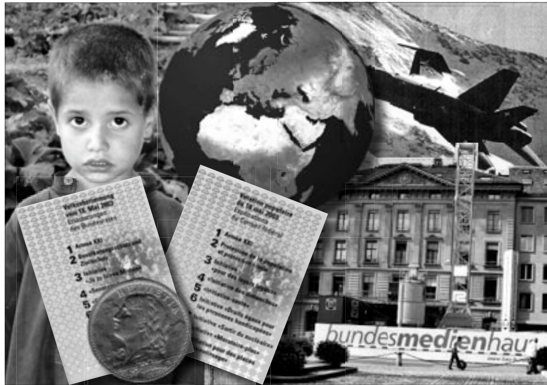
La manipulation empêche des solutions objectives dans tous les domaines.

L'initiative populaire «Souveraineté du peuple sans propagande gouvernementale» exige que le Conseil fédéral s'en tienne désormais au droit en vigueur ainsi qu'aux principes de la démocratie directe, qu'il informe les citoyens de manière objective et neutre sur les projets de loi soumis à votation. Actuellement, la Constitution fédérale précise déjà que «la garantie des droits politiques protège la libre formation de l'opinion des citoyens et des citoyennes et l'expression fidèle et sûre de leur volonté» (art. 34, al. 2 actuel). Le Tribunal fédé-